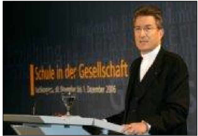
Bischof Dr. Huber

Wenn häufig davon die Rede ist, dass die Schule, um Lernort sein zu können, zunehmend zum Lebensort werden muss, dann enthält diese Forderung zugleich eine Defizitanzeige. Gibt es denn keine Lebensorte, die die Schule vor dieser Überforderung bewahren können?