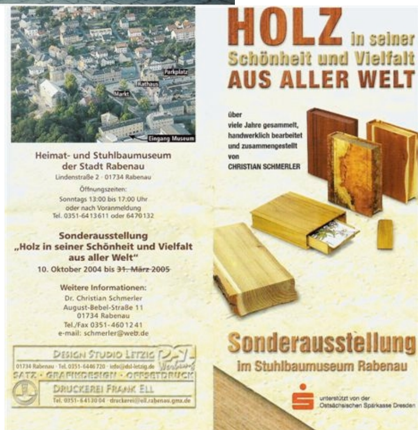
Sonderausstellung „Holz in seiner Vielfalt“