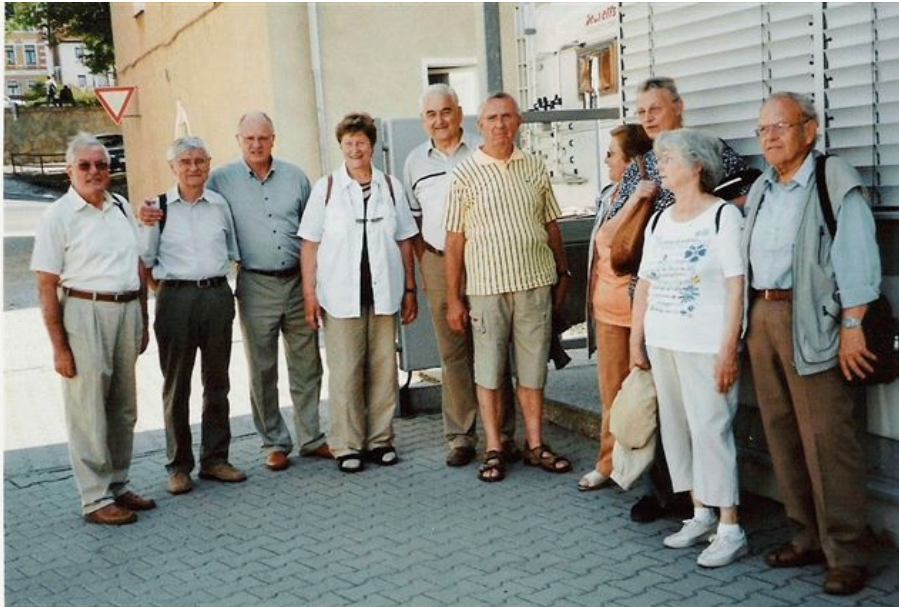
Die Aktivsten unserer Seniorengruppe