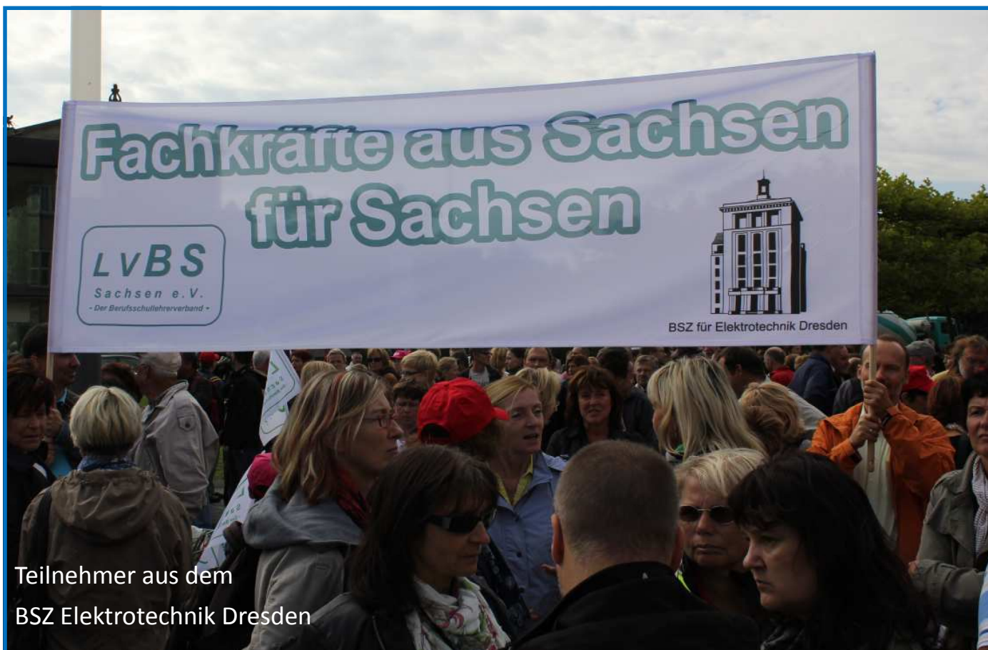
Teilnehmer aus dem BSZ Elektrotechnik Dresden

Dieser Forderung verliehen am 7. September 2012 ca. 15.000 Lehrerinnen und Lehrer, darunter auch viele Mitglieder des LVBS Sachsen e. V. mit einem ganztägigen Warnstreik und einer Kundgebung vor dem Sächsischen Landtag Nachdruck und begleiteten so den offiziellen Startschuss zur Landtagsdebatte des Doppelhaushaltes 2013/2014.