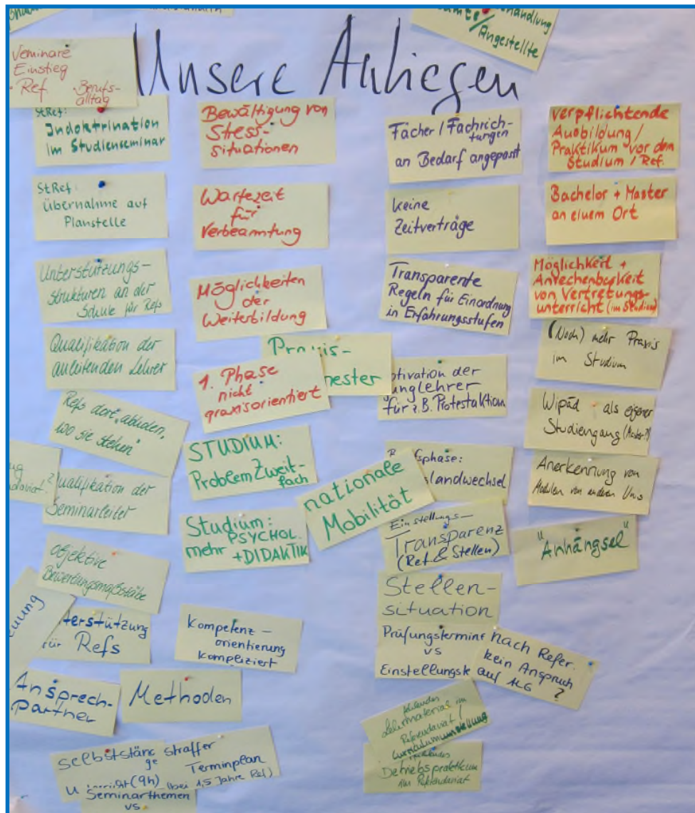
Ergebnisse des Brainstormings

(„Duldungsmentalität“ seitens der Professoren und Dozenten), die Umstellung des Curriculums im Studienseminar inklusive dem Wegfall der begleitenden Materialien („Grünes Heft“) sowie das nicht in der Rechtsverordnung (LAPO II) festgeschriebene verpflichtende Betriebspraktikum von vier Wochen im ersten Referendariatsjahr, das es in anderen Bundeslän-