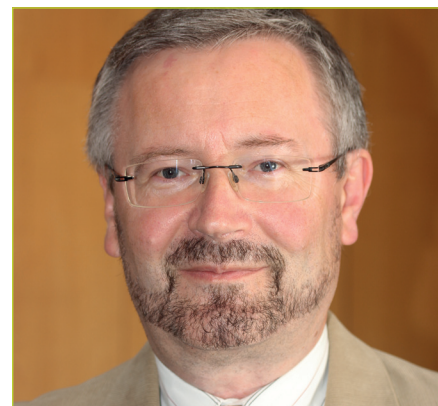
von Frank Oertel

Aus einer Anforderung einer Personalversammlung, vom 15. März 2017, entwickelte sich eine aufschlussreiche Ausarbeitung zum Thema „Bezüggemittelung erläutern/VBL“.