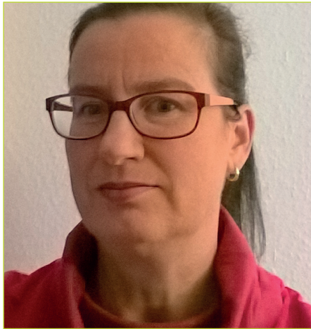
von Birgit Bourdoux Regionalverband Leipzig

Liebe Mitglieder, wir haben in den vergangenen Tagen von der VBL den Nachweis über die Anmeldung erhalten und viele haben sich über den Versicherungsbeginn 01.08.2017 gewundert und in der Bezügestelle angerufen, um anschließend doch verunsichert nachzufragen, ob denn das alles so in Ordnung geht. Vom Kundenservice der VBL erhielt ich folgende Aussage: