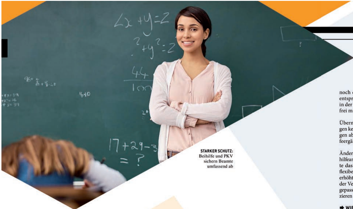
STARKER SCHUTZ: Beihilfe und PKV sichern Beamte umfassend ab