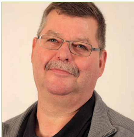
von Jürgen Fischer

Im Jahr 2019 beginnen die Tarifverhandlungen zur Einkommensrunde mit den Ländern zum TV-L (Tarifgemeinschaft deutscher Länder, TdL).