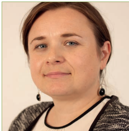
von Kathleen Dilg

Die Pflegeberufe unterliegen als reglementierte Berufe dem Bundesrecht und einer besonderen Finanzierung. Traditionell erfolgt die Finanzierung über die Kostenträger (z.B. Krankenkassen). Das neue Pflegeberufegesetz regelt die Finanzierung neu und bindet dabei neben den alten Kostenträgern das jeweilige Bundesland ein.